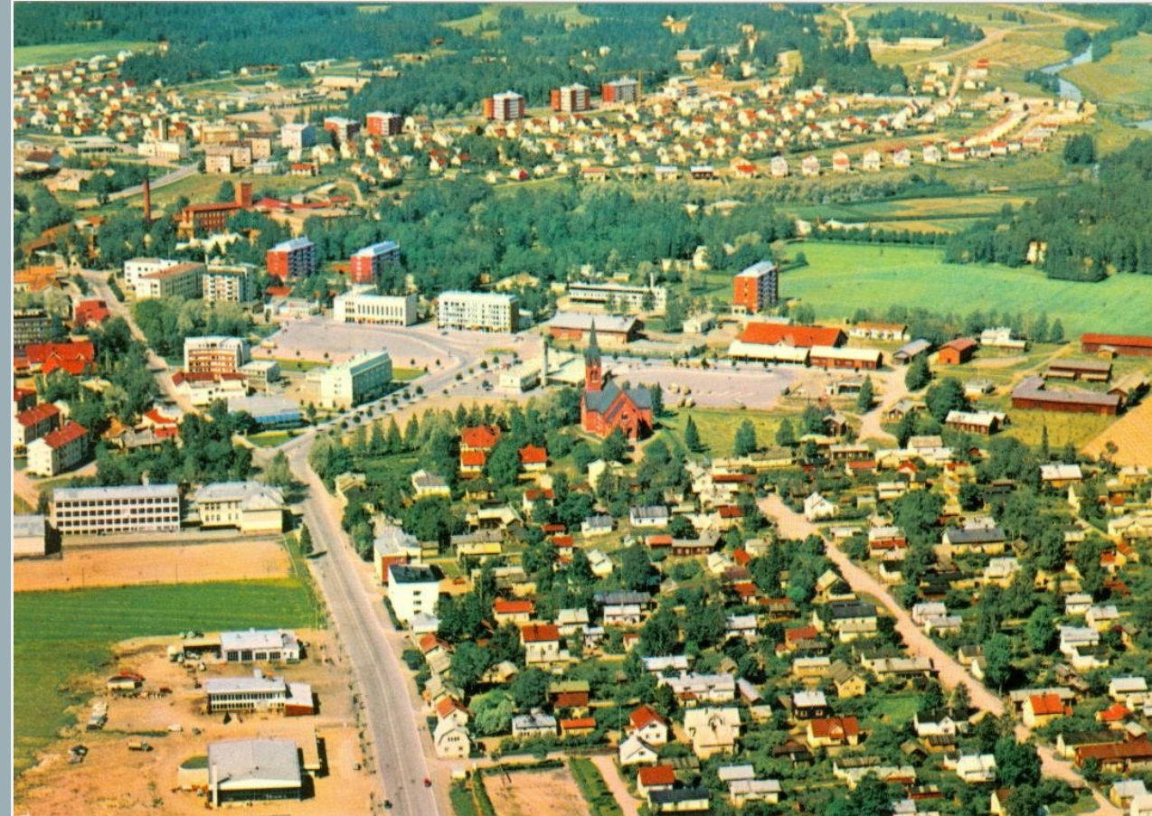
Forssan keskusta 1960-luvulla.