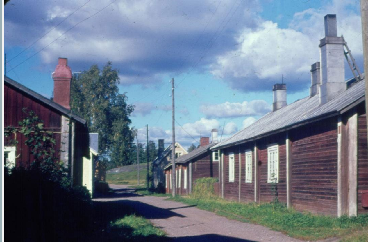
Kalliomäkeä kuvattuna vuonna 1963.

Valtakunnallisesti merkittävät rakennetut kulttuuriympäristöt edustavat maamme kehitysvaiheita ja ovat historian kuvastajia. Kyse on perinteen säilyttämisestä ja alueiden kehittämisestä niiden arvoja vahvistavalla ja niihin sopeutuvalla tavalla.