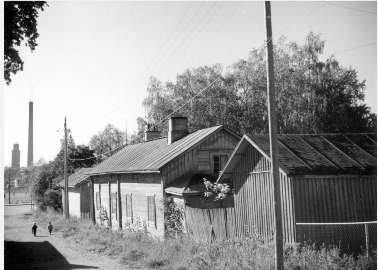
III linja 4. rakennus vuonna 1963.

Säilyttämisen ja muutosten laajuus ja sisältö ratkaistaan kaavoituksen kautta.